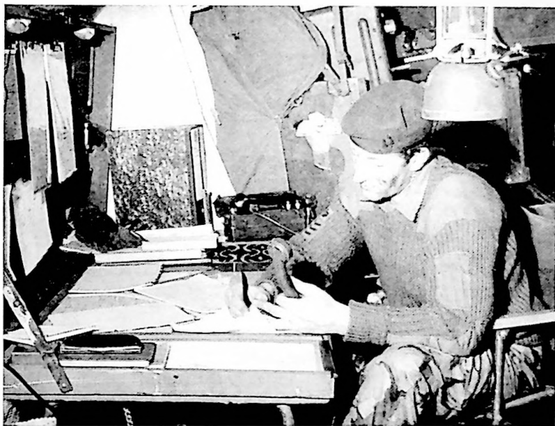
Squadron command post in a Com- mando Logistic and RAOC squadron

Attache and Missions overseas, computer systems operator and many others. On completion of his basic trade training the man will join a RAOC unit or detachment for on-the-job-training and will normally return to the Training Battalion RAOC for upgrading courses at a later stage in his career.