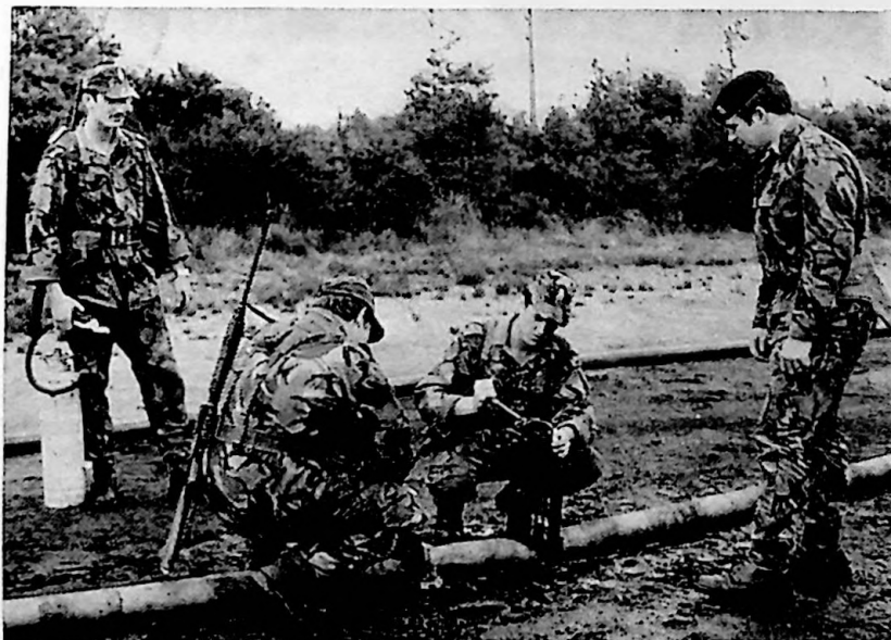
Petroleum operators of the RAOC work on a flexible pipeline

An adult soldier, after the basic recruit course, has a vast range of trades to choose from. These include all those available at the Apprentices College plus driver, butcher, ammunition technician, staff clerk for duties in large HQs and with Military