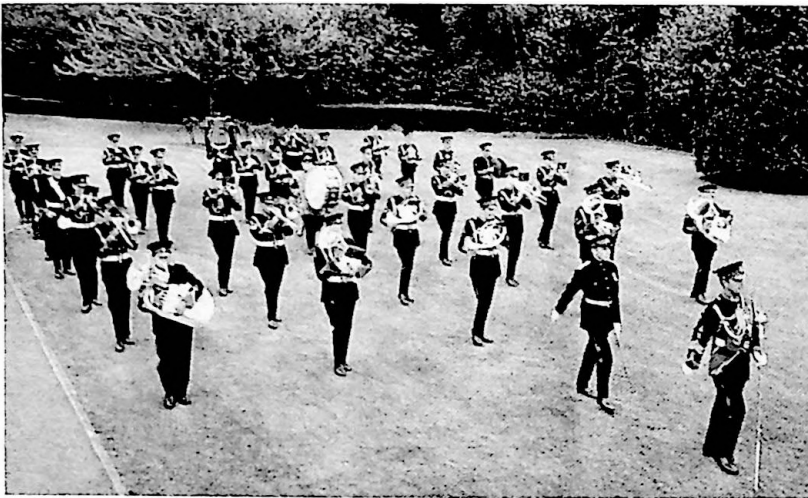
Members of the Royal Ordnance Corps Band rehearsing at the RAOC Training centre

ron of the RCT. Corps troops are supplied from vehicle and stores companies under the control of the Deputy Director of Ordnance Services (DDOS) at Corps HQ. There is no doubt that the concentration of the supply of ammunition, stores, weapons and vehicles into the hands of one Corps has greatly reduced the movement and handling overheads at the same time providing a more efficient and speedy service to the users. The constant pressure of economy has caused the emphasis to be placed on the 'teeth arms'. These are kept up to or near wartime strength often at the cost of over-reductions in the supporting services. The peacetime RAOC units stationed in the Central Region would be insufficient to provide an adequate service to the British 1 Corps without augmentation.