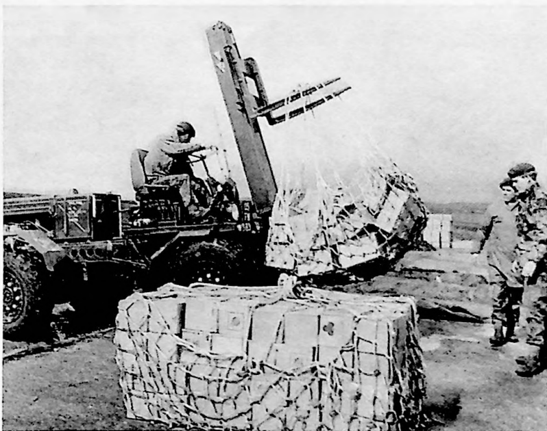
Supplies being prepared for helicopter transportation as 'underslung loads'

The most 'glamorous' course today, because of the Ulster emergency, is the Ammunition Technical Officers Course, which is a 60 week course run at the RAOC's Army School of Ammunition in conjunction with the Royal Military College of Science. This course provides advanced training in all aspects of land service ammunition, explosives, chemical weapons, solid and liquid propellants and the explosive components of guided missiles. After