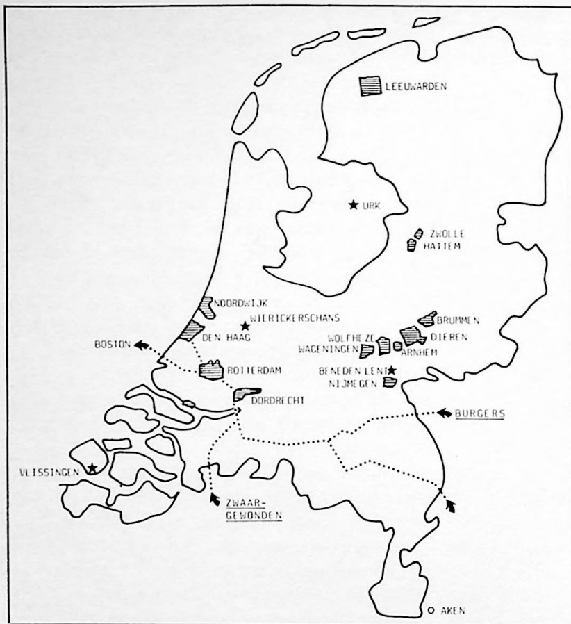
Gearceerd de verschillende interneringsgebieden; de sterretjes duiden de speciale depots aan, de stippellijnen de transportroutes

ring in dit werk opgedaan als kampcommandant van een interneringsdepot voor Belgen.