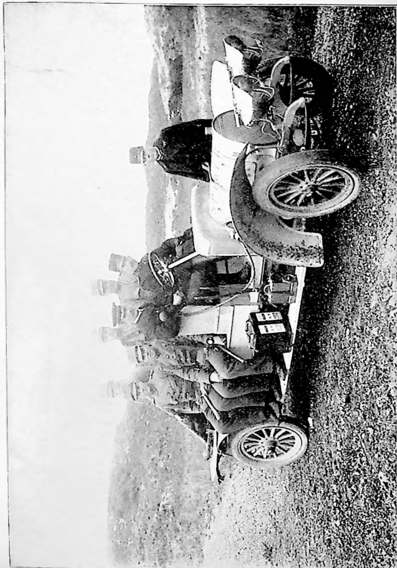
SPYKER-AUTO TEN DIENSTE DER KUSTVERDEDIGING.